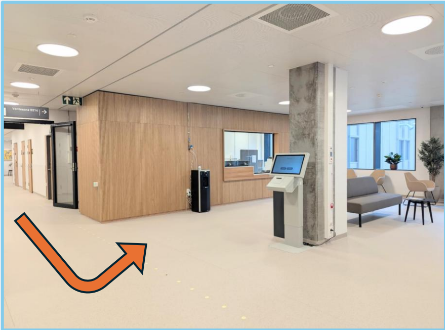
Помаранчева стрілка показує, звідки ви прийшли.

3. Це зона очікування B214 для пацієнтів, які йдуть на МРТ. Інколи тут увімкнене радіо або телевізор. Будь ласка повідомте нам, якщо потрібно зробити звук тихішим.